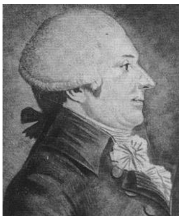
Figura 4. Retrato de Guyton de Morveau.

Para comprendermos mellor a nomenclatura química revisar a referencia (4) e as alí citadas. Si cómpre sinalar que, aínda cando Lavoisier pasa por ser o pai da nomenclatura química, o verdadeiro artífice foi Guyton de Morveau.