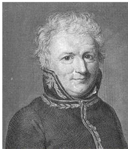
Figura 3. Jean Henri Hassenfratz.