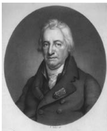
Figure 5. Claude Louis Berthollet.

Lavoisier tivo a habilidade de comprender a transcendencia do que estaba a facer Guyton e simplificouno moito máis botando man das ideas de Condillac, quen pensaba na Ciencia “como nunha Linguaxe ben feita” e utilizaba as Matemáticas como modelo de coñecemento. Con estas ideas novas, Guyton, transformou a súa nomenclatura e, Lavoisier, fixo: A introdución do traballo, vendeu o produto e aproveitouse das normas coma se foran propias del.