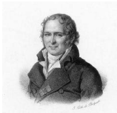
Figura 6. Antoine François de Fourcroy.

Guyton, Lavoisier, Fourcroy e Berthollet son os creadores da moderna nomenclatura química. O principio básico destas normas era unha lóxica de composición: