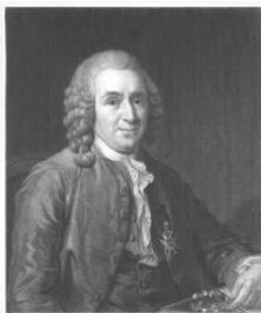
Figura 1. Carl von Linneo