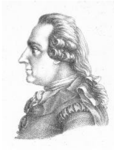
Figura 2. Tobern Olof Bergman