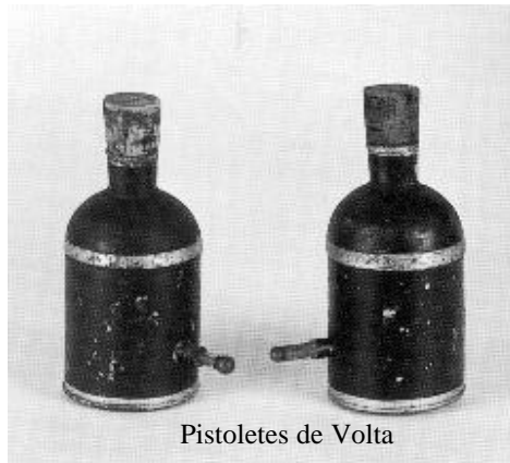
Pistoletes de Volta

Nesta sala, preséntanse os instrumentos destinados: a comprobar que a electricidade se acumula nas superficies curvas ou que se dispón na superficie externa dos conductores, a reproducir as experiencias do pararraios, a estudar os efectos das descargas eléctricas, etc. As primeiras máquinas para obter electricidade fregando un cilindro de vidro, os electroscopios, os electróforos e os primeiros condensadores, achégnanos ós alicerces dun saber que marcaría o evoluir do século XIX.