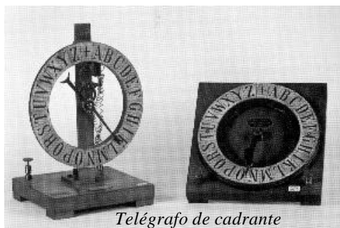
Telégrafo de cadrante

7. As maravillosas aplicacións da electricidade. Nesta sala, móstranse algúns dos inventos da época, moitos deles empregados con fins didácticos nos centros de ensino, que reflicten as grandes e maravillosas aplicacións da electricidade en tódolos campos da nosa vida.