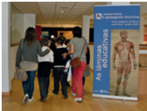
Museo Pedagóxico de Galicia. Entrada Exposición Temporal

Ao longo da exposición veremos espazos con láminas murais expostas por temática común como son a Botánica, a Zooloxía ou a Anatomía e outro de miscelánea alberga láminas dos editores nacionais e europeos máis representativos da época de mediados do XIX ata mediados do século XX.