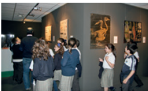
Museo Pedagóxico de Galicia. Recorrido Exposición Temporal